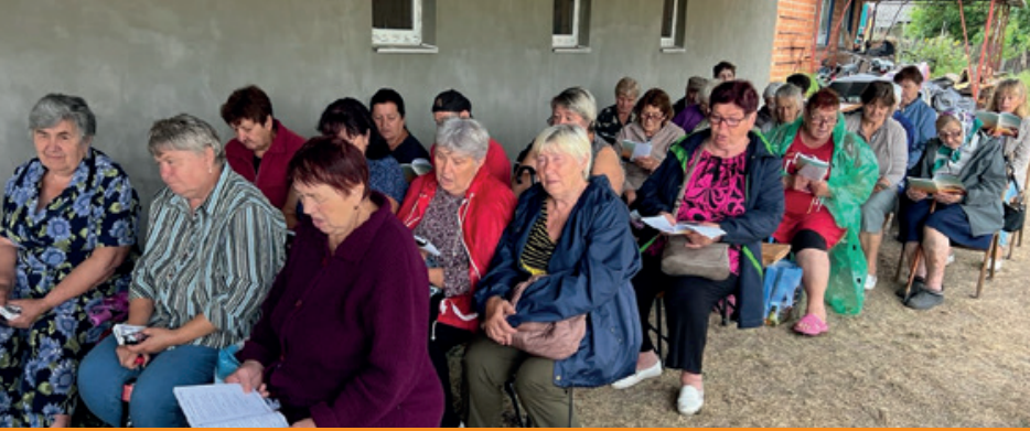
Lesen von christlicher Literatur beim Warten auf die Behandlung