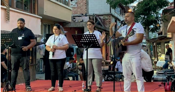
Konzert im Stadtteil Nadeschda in Sliwen, Bulgarien