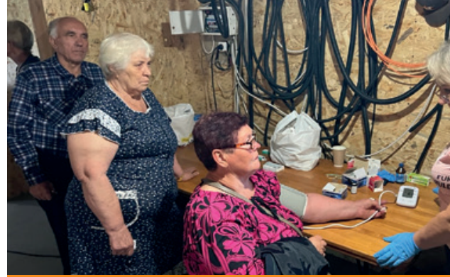
Medizinische Hilfe durch die mobile Klinik