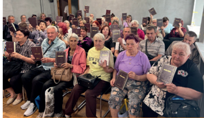
Teilnehmer des Bibelkurses mit ihrem Bibelgeschenk