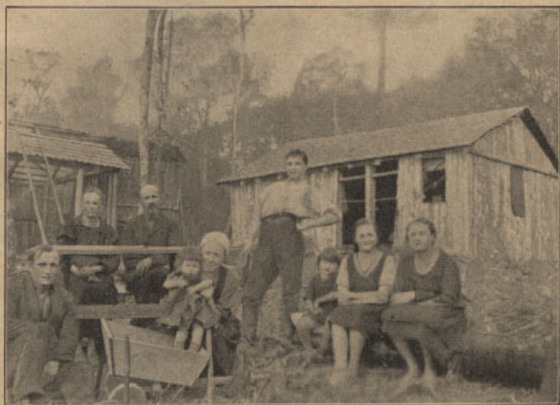
Das ist die Wohnung des Schreibers, dieses Briefes

Als wir ankamen, war doch mancher sehr enttäuscht. Ich hatte viel Mut und Hoffnung und konnte von meinem Vorrat noch manchem abgeben. Drei Wochen wohnten wir in den gemeinsamen Baracken, dann aber ging es in den Urwald, in ein kleines Häuschen hinter den großen Bäumen. Vier Wochen haben wir an unserem Häuschen gearbeitet. Mit Schindeln, die wir aus den hohen Pinien machten, haben wir das Dach gedeckt, und die Wände stellten wir aus Palmenstämmen auf. Das Häuschen ist acht Meter lang und vier Meter breit, hat vier Fenster und eine ganz nette