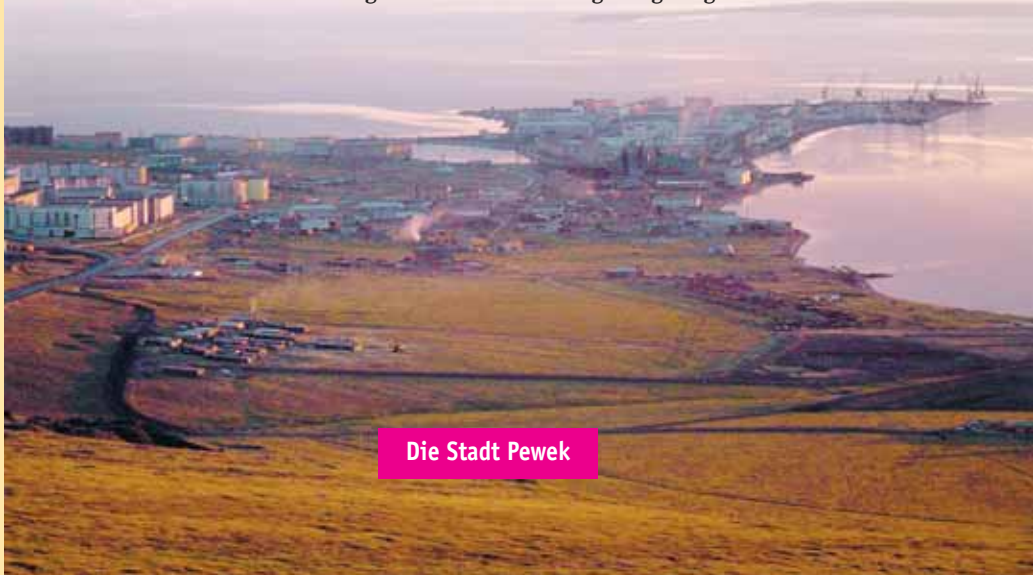
Die Stadt Pewek