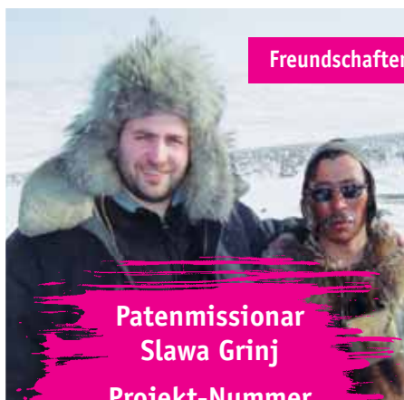
Freundschaften mit Einheimischen