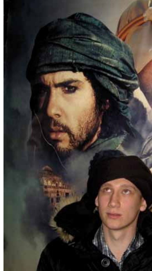
„Die Weisen aus dem Morgenland“

Auch eine Jugendevangalisation haben wir durchgeführt und dabei etwas Neues ausprobiert. Wir bildeten ein Team aus acht jungen Erwachsenen. Vier weitere Personen aus der Gemeinde Samara schlossen sich uns an. Unser Ziel war, zuerst Kontakte zu ungläubigen Jugendlichen zu knüpfen und ihnen dann in verständlicher Form von Jesus zu erzählen. Den Kontakt knüpften wir durch die Aktion „Fotocross“, die damit begann, dass die jungen Mitarbeiter eine Anzeige in die sozialen Netzwerke im Internet setzten und zusätzlich Einladungszettel in der Stadt verteilten. Dann trafen sie sich zum vereinbarten Zeitpunkt am vereinbarten Ort in der Stadt. Es kamen 32 uns unbekannte junge Menschen, die wir dann in Gruppen von fünf bis acht Personen mit jeweils einem gläubigen Leiter aufteilten.