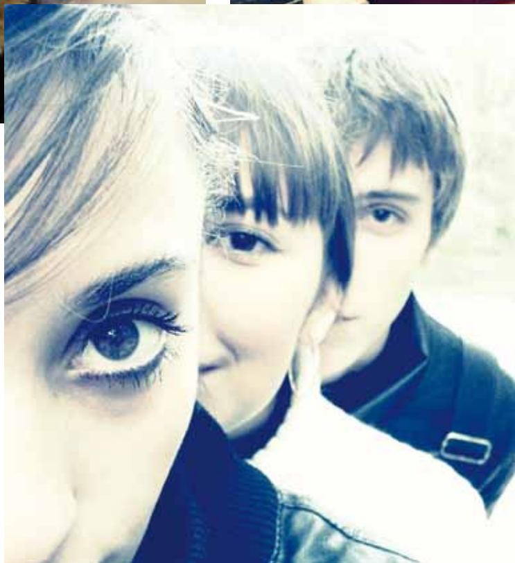
„Auge um Auge“

Team kamen dann alle Gruppen am vereinbarten Ort wieder zusammen, um die Fotos an die Veranstalter zu überspielen.