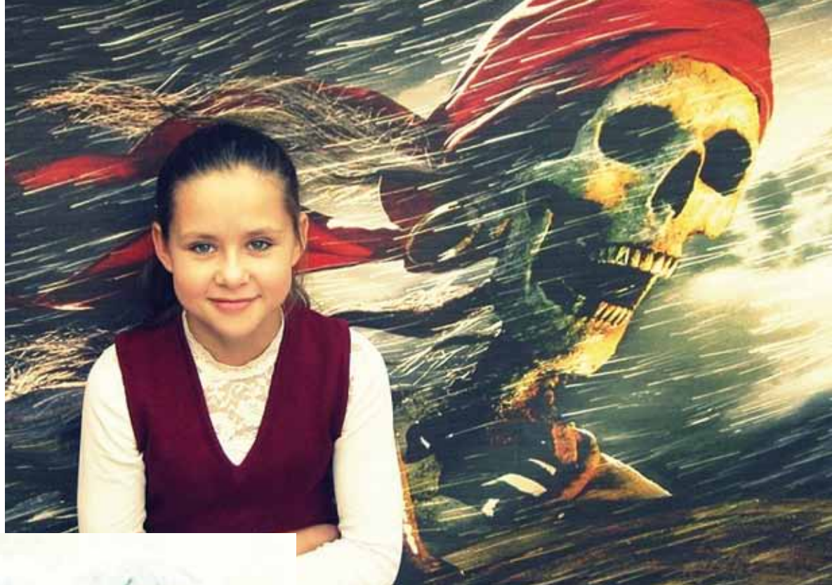
So stellte sich dieses Mädchen das Thema „Liebreiz trägt“ vor.